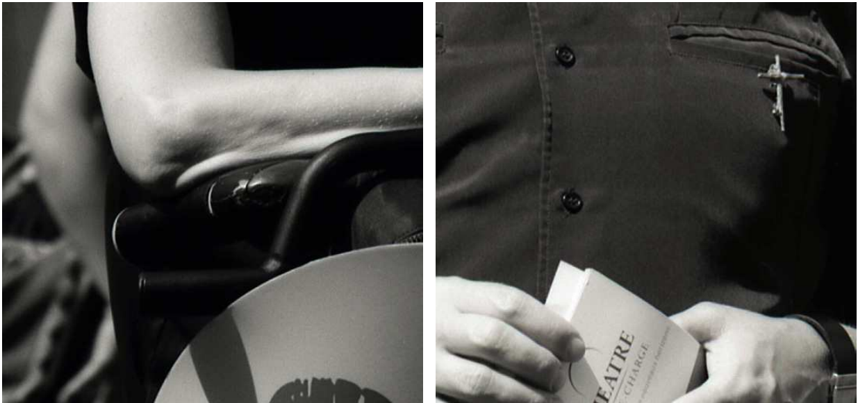
Rollei RETRO 80S (35 mm) développé avec B.K.A. UFG Ultra Fine Grain

Rollei RETRO 80S à 80 ISO (RHS 1+15 - 5'00" - 20°C)