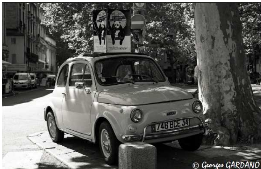
Rollei RETRO 80S à 80 ISO (UFG 1+5 - 10'00" - 20°C)