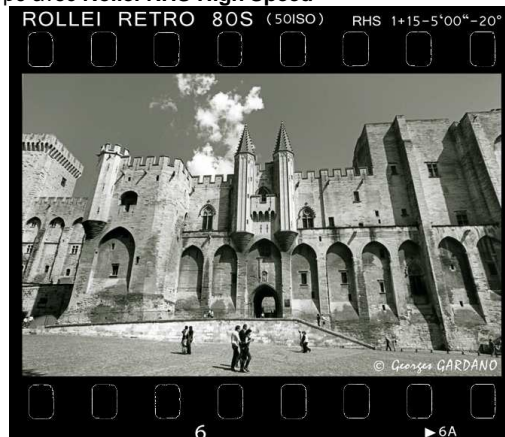
Rollei RETRO 80S à 50 ISO (RHS 1+15 - 5'00" - 20°C)