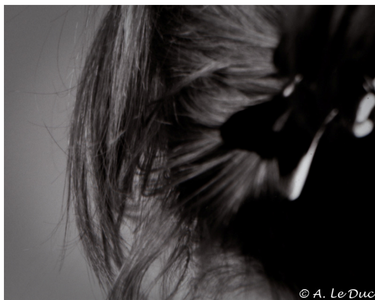
Figure 7: Extrait de la figure 6 (cadre noir).