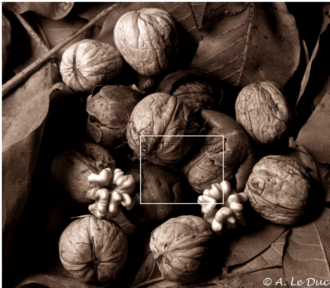
Figure 10 : Exemple de photographie réalisée avec la Rollei Retro 80S (exposée à ISO 160) et développée dans du HC-110. Le cadre blanc correspond à la zone agrandie en figure 11.

Ce révélateur permet au film d'atteindre une vitesse d'ISO 160.