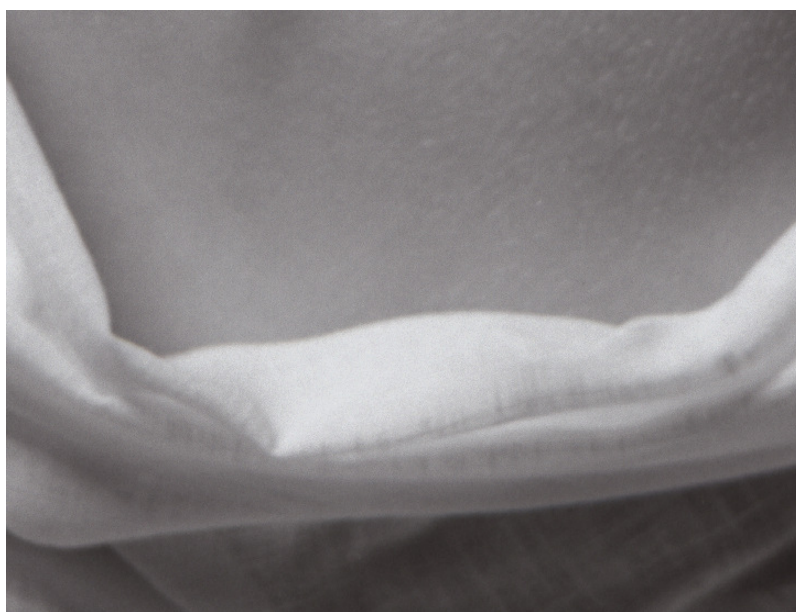
Figure 3 : Extrait de la figure 2 (cadre noir).