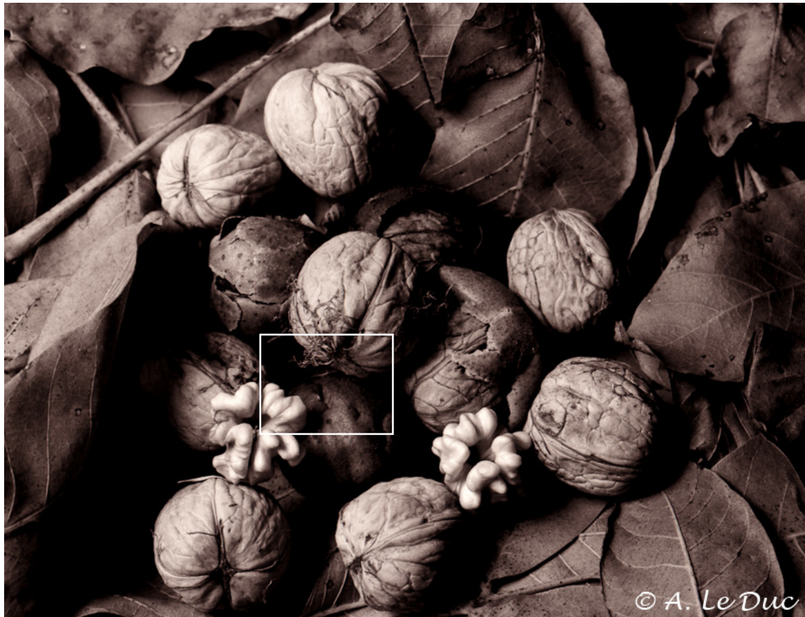
Figure 8 : Exemple de photographie réalisée avec la Rollei Retro 80S (exposée à ISO 80) et développée dans du PMK. Le cadre blanc correspond à la zone agrandie en figure 9.