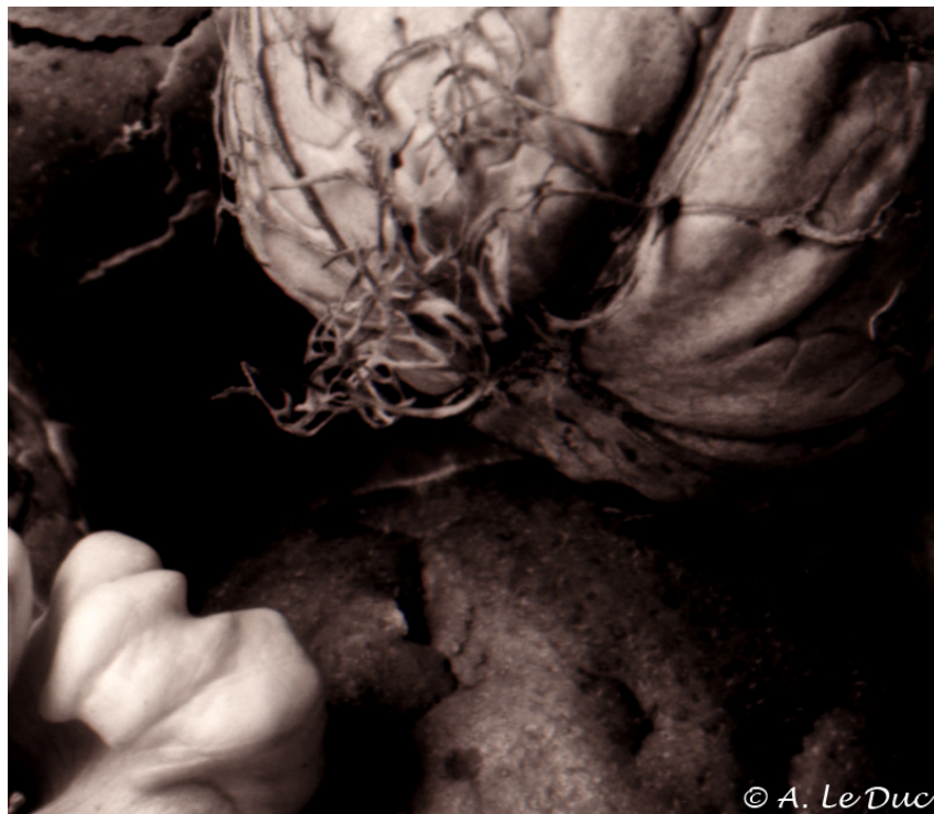
Figure 9: Extrait de la figure 8 (cadre blanc).