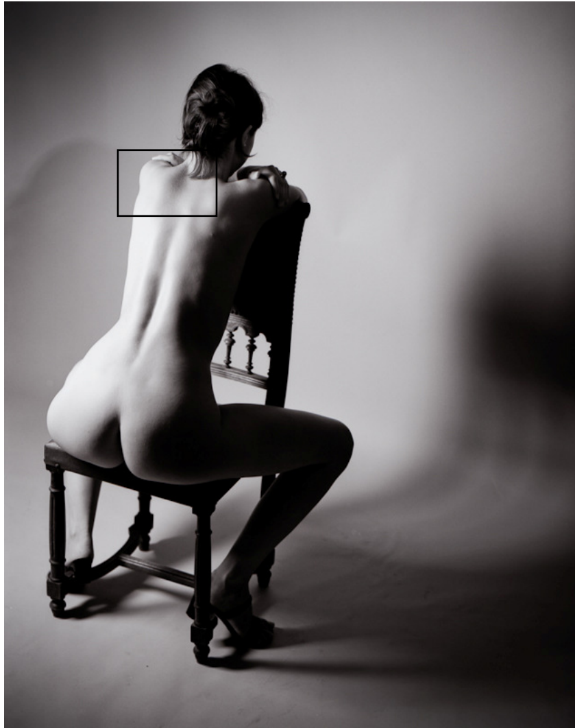
Figure 4 : Exemple de photographie réalisée avec la Rollei Retro 80S (exposée à ISO 50) et développée dans du RLS. Le cadre noir correspond à la zone agrandie en figure 5.