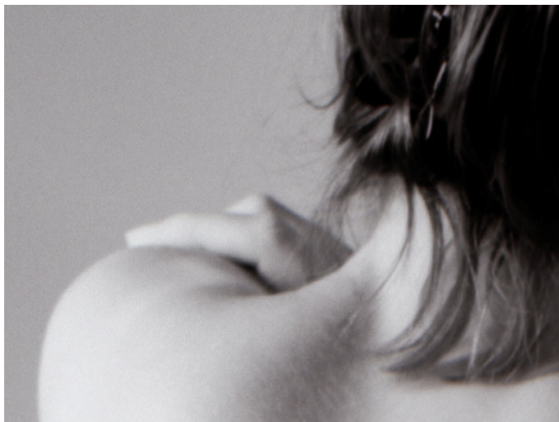
Figure 5: Extrait de la figure 4 (cadre noir).