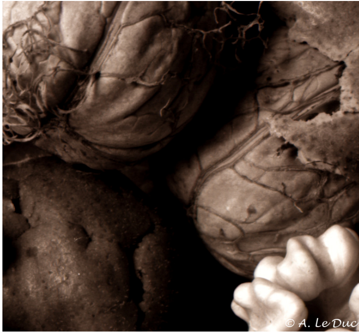
Figure 11: Extrait de la figure 10 (cadre blanc).